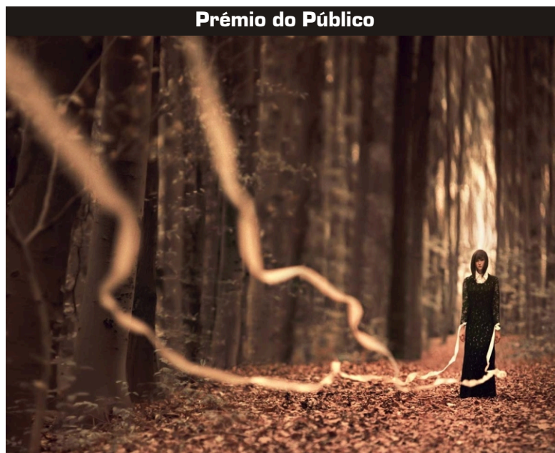
Prémio do Público