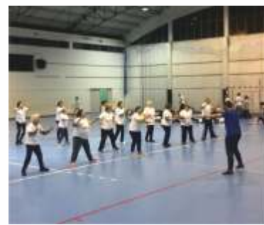
ATIVIDADE DESPORTIVA SÉNIOR

Apoio integrado municipal que garante a promoção dos direitos e proteção do idoso. Constituída por equipas técnicas multidisciplinares, a Comissão tem o foco no acompanhamento integral dos idosos da comunidade.