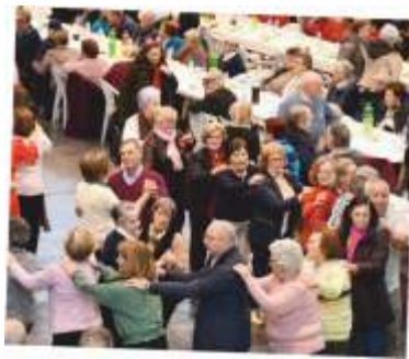
ALMOÇO CONVÍVIO DE NATAL

Trata-se de uma atividade inclusiva, com o objetivo de combater o isolamento social, que tem como mote celebrar a vida e a alegria, recheada de boa disposição e muitos miminhos.