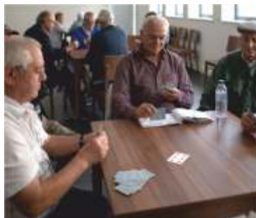
ATIVIDADES LÚDICAS DIVERSAS

Trata-se de uma atividade inclusiva, com o objetivo de combater o isolamento social, que tem como mote celebrar a vida e a alegria, recheada de boa disposição e muitos miminhos.