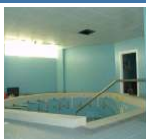
Balneário Termal de Chaves (interior)