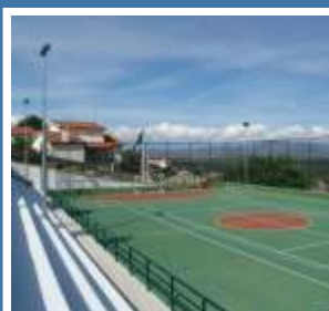
Polidesportivo de Bustelo