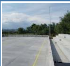
Polidesportivo de Samaiões