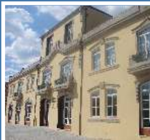
Biblioteca Municipal de Chaves