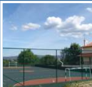
Polidesportivo de Soutelo