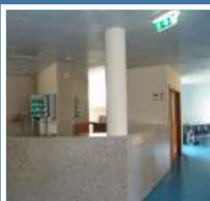
Balneário Termal de Chaves (interior)