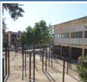
Mercado Municipal de Chaves