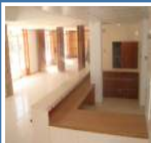
Biblioteca Municipal de Chaves (interior)