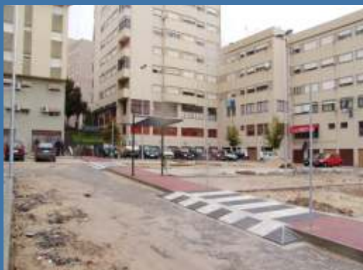
PARQUE DE ESTACIONAMENTO (RAPOSEIRA)