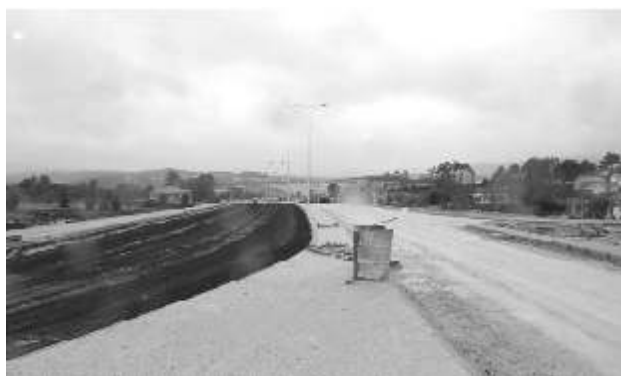
Acesso da A24 ao centro da cidade cada vez mais próximo