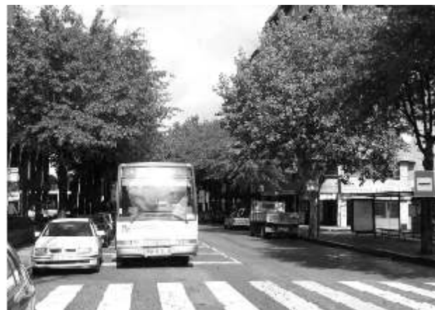
No mês de Setembro, registou-se um significativo aumento dos utentes dos transportes públicos, atingindo nove mil registos de entrada nos autocarros