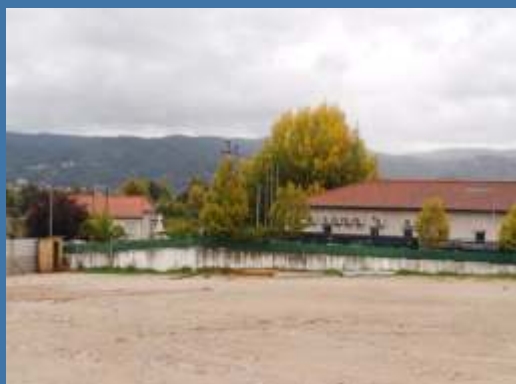
AMPLIAÇÃO DO CENTRO DE SAÚDE Nº 1