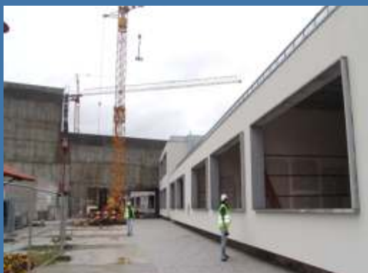
CENTRO CULTURAL DE CHAVES