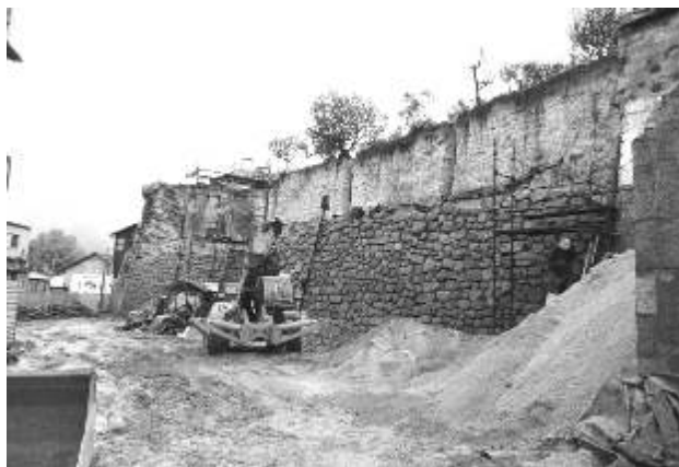
Obras de recuperação da Muralha do Baluarte em elevado ritmo