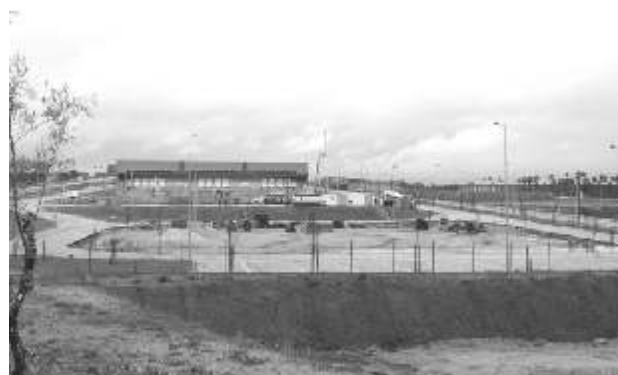
Construção do terceiro pavilhão do Mercado Abastecedor