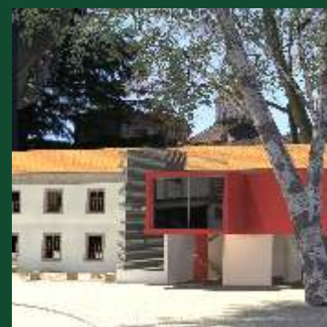
Pousada da Juventude