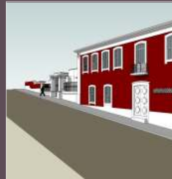
Centro de Convívio para Idosos (Antigo M...)