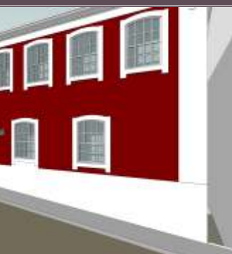
Ciência Viva (Magistério)